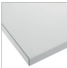
Piano in nobilitato con bordo ABS, disponibile nei colori rovere sbiancato e bianco

Melamine top, available in white oak and white finish