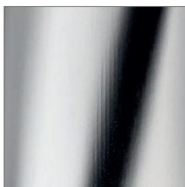
Finitura cromata Chrome finish