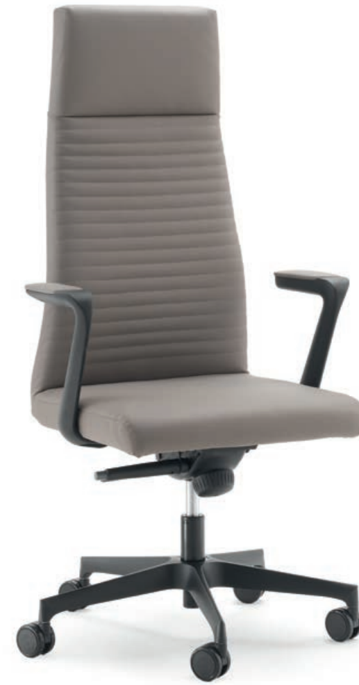
COD LC011A Schienale alto, braccioli in PU nero con top imbottito High back, black PU armrests with upholstered top