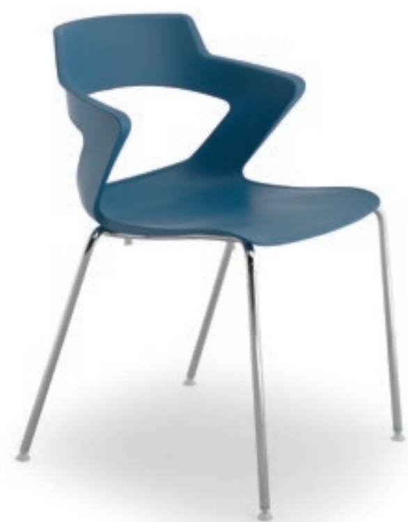
ZN001CR Sedia 4 gambe, cromata Four legged chromed chair.