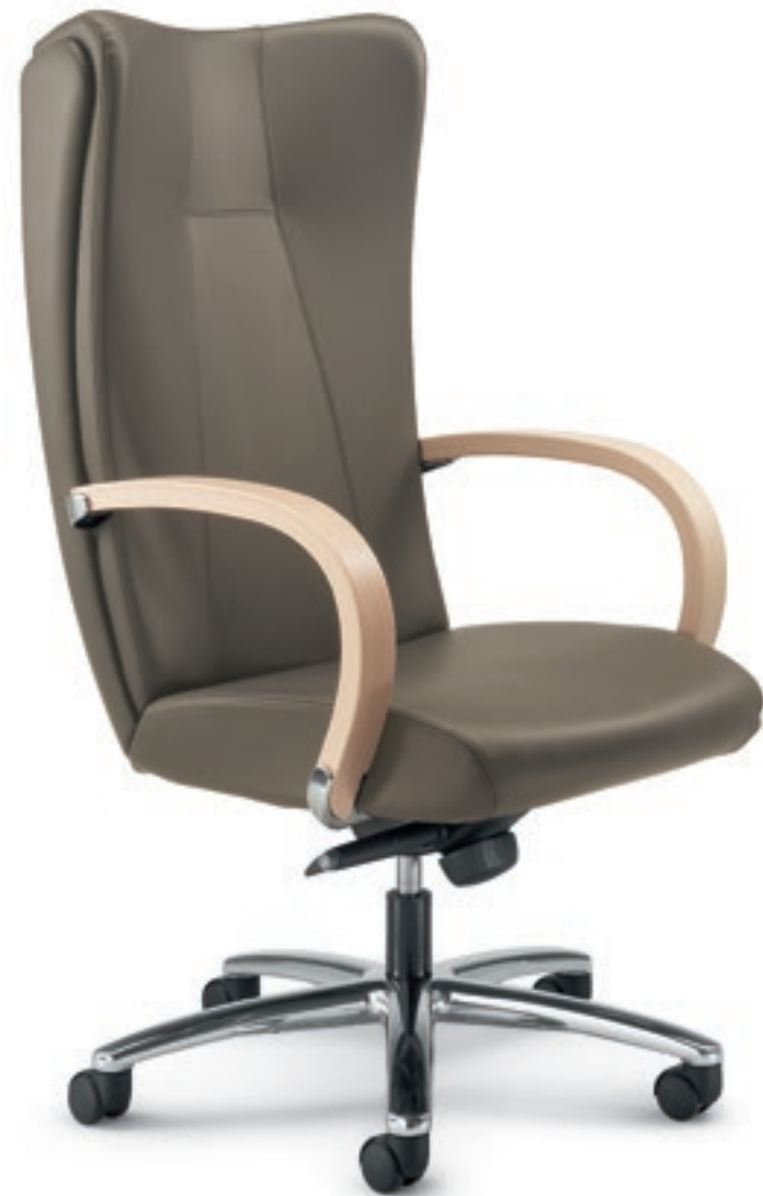
KI161A Schienale alto, meccanismo oscillante a fulcro avanzato, braccioli verniciati High back, forward tilting mechanism, stained armrests