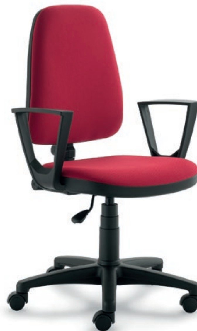
EG152F Schienale alto, contatto permanente, braccioli fissi High back, permanent contact, fixed armrests

Basic task seating that has been developed to meet the need of a great value for money range that still features total ergonomic and heavy duty characteristics. Major features of this collection are the high density padding, the fiberglass reinforced nylon bases, the seat that is reinforced with steel bars.