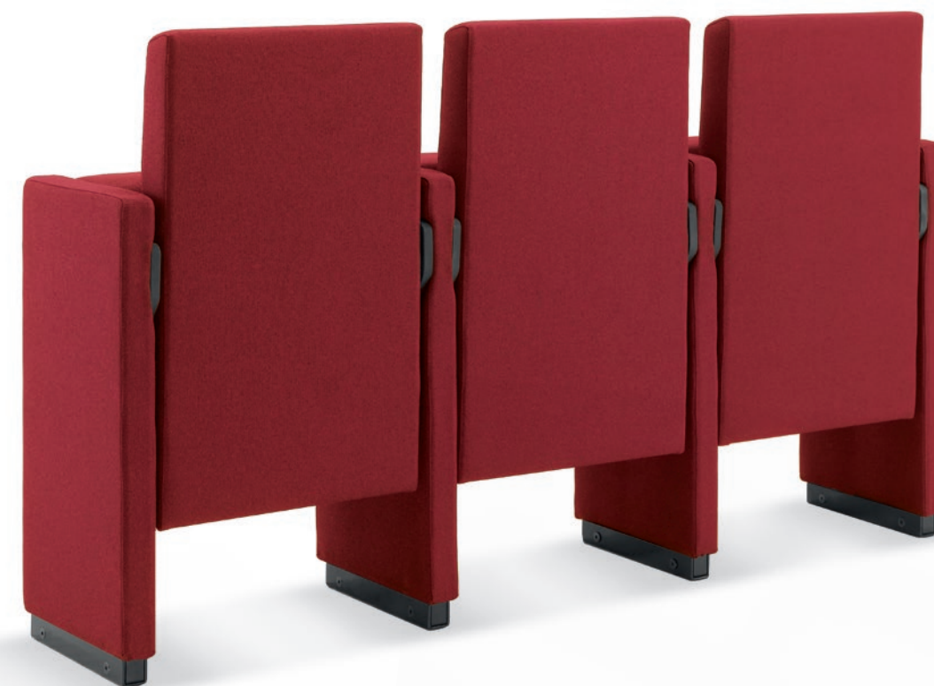
SC001 Poltrona imbottita con meccanismo di apertura sedile/schienale e fianco a terra Upholstered armchair with movable backrest

A special mechanism: a patented nylon component that operates the seat and backrest in a synchronized way. When the user stands, the backrest regains its original vertical position with a depth of only 32 cm. This reduced dimension allows for more rows to fit into auditorium and conference rooms with higher safety standards in case of an emergency.