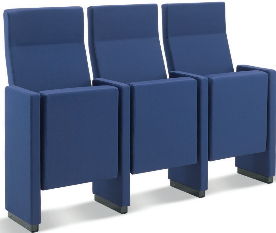
AS201 Poltrona a schienale alto imbottita con bracciolo destro Upholstered armchair with high back