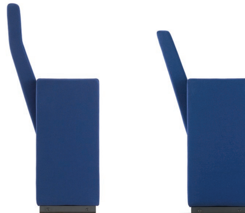
AS201 Poltrona a schienale alto imbottita con fianco a terra Upholstered armchair with high back

Seating collection for auditorium and conference rooms. The armchair has a distinguished look that features technical options for top comfort and different assembling alternatives.