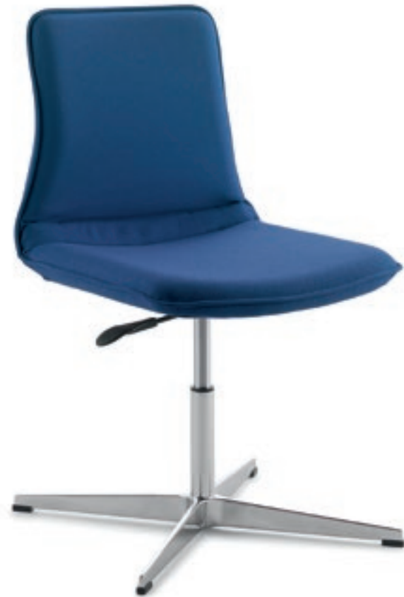
IC211 Poltrona girevole, senza braccioli, base a 4 razze in alluminio lucido Swivel chair, no armrests, 4-sprong base in polished aluminium

Un tocco di eleganza propone la versione fissa su base a 4 razze in alluminio pressofuso. Disponibile con e senza braccioli è ideale come seduta per una postazione di home office o come seduta per sala riunione.