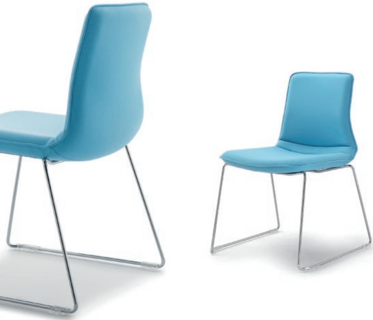
IC201 Struttura cromata, senza braccioli Chromed frame, without armrests