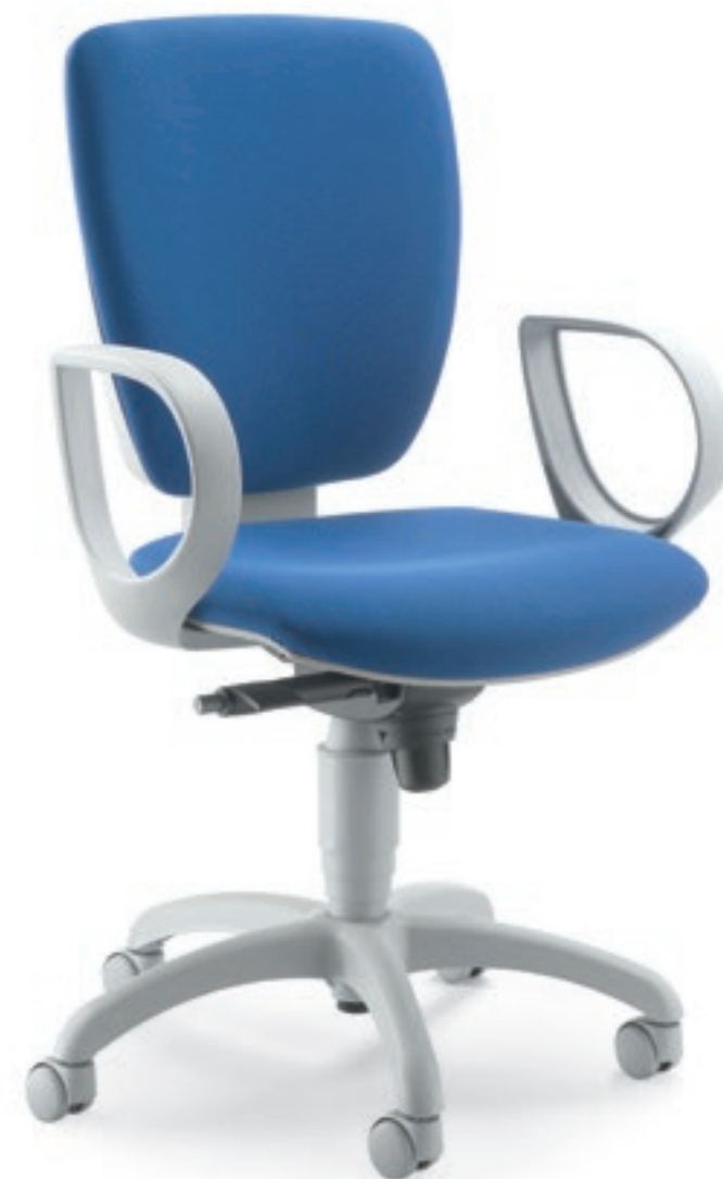
GA102GS+BR109 Schienale alto, syncro, braccioli fissi High back, synchro mechanism, fixed armrests

With a simple yet distinct design, Gamma ranks among the favourites for its sturdy yet elegant appearance.