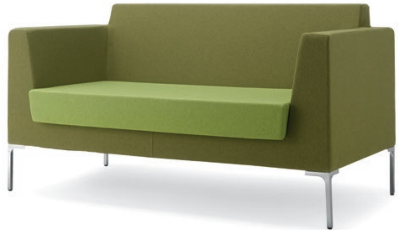
FR002 Divano imbottito Two-seater, fully upholstered