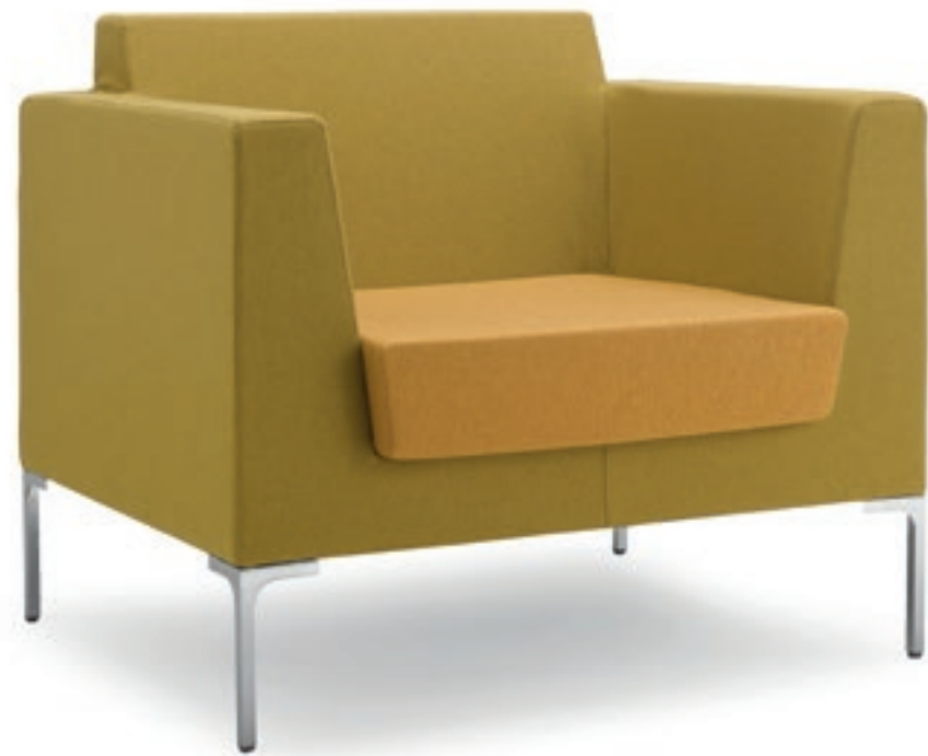
FR001 Poltrona imbottita Armchair, fully upholstered