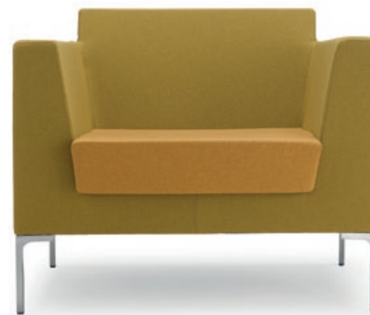
FR001 Poltrona imbottita Armchair, fully upholstered

Range of sofas and armchairs with compact design. FRED has soft and easily fitting seatings to satisfy almost any need in modern office and contract spaces.