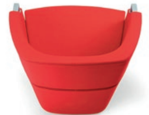
AT070 Poltrona imbottita Armchair, full upholstered