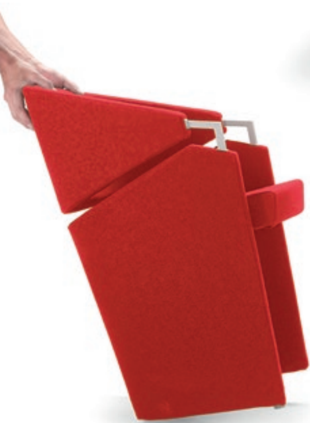
AT070X Poltrona imbottita, tavoletta scrittoio Armchair, full upholstered, writing tablet