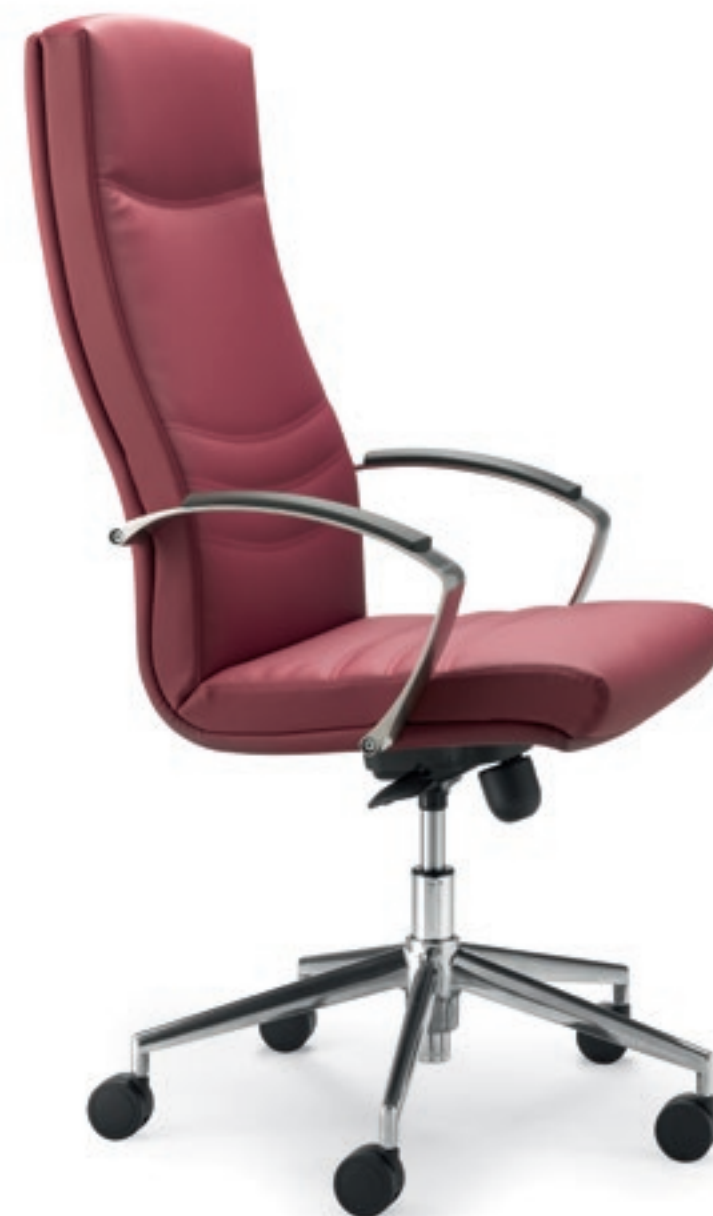
AF011A Schienale alto, meccanismo oscillante a fulcro avanzato, braccioli in alluminio lucidato con top in PU nero High back, forward tilting mechanism, polished die-cast aluminium armrests with black PU top

The evolution of a classic design, Alfa fits perfectly into the modern office and home office spaces alike. Chrome and aluminium accents are a stylish addition to the working area.